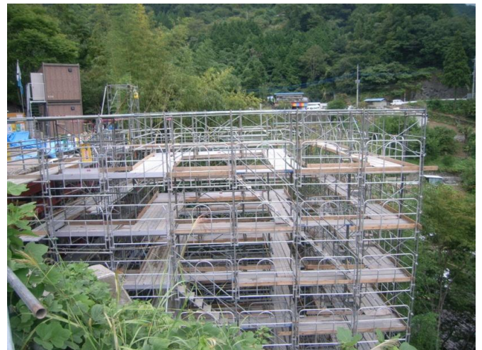
足場の組立が完了しました。