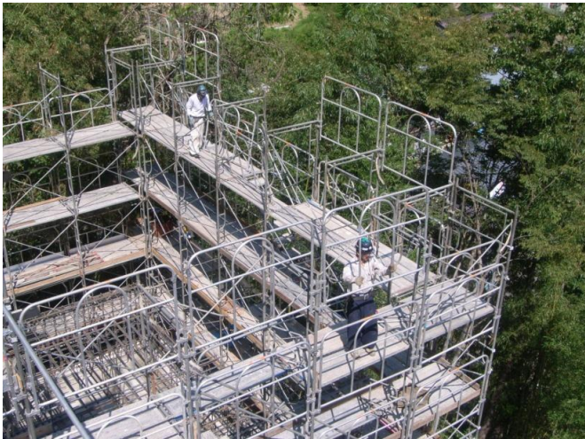
足場を組み立てています。