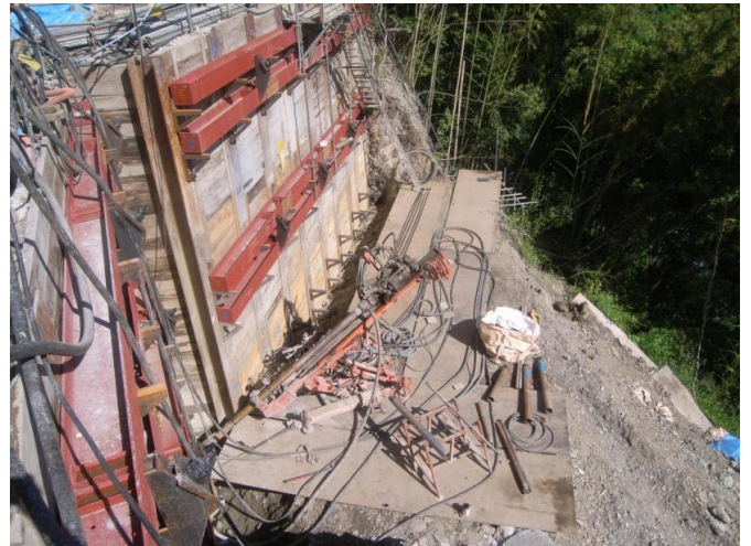
3段目のアンカー工を施工しています。