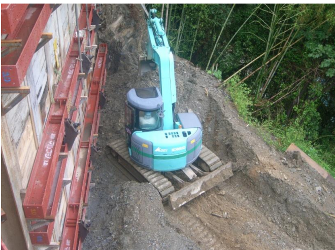
アンカー工完了後に掘削しています。